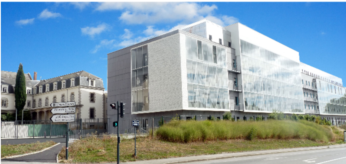
Le nouveau bâtiment accueillant l'unité d'hospitalisation de médecine post-urgences

Renforçant l'unité de médecine polyvalente (UMP) ouverte en novembre 2017 à Pontchaillou, au 9 e étage du bâtiment principal, ce dispositif sera complété, d'autre part, en décembre par la mise à disposition de 15 lits réservés au CHU au sein d'une unité de médecine polyvalente de 28 lits de Saint-Laurent .